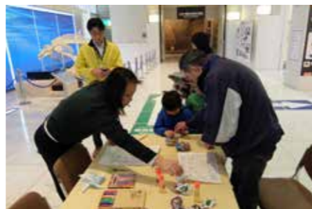
平成30年2月11日 「博物館Vキング」の様子