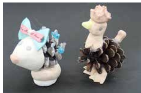
「松ぼっくりと貝で遊ぼう」の作品例