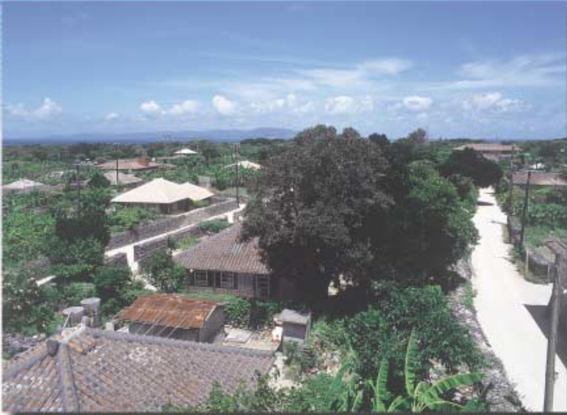
沖縄県八重山郡竹富島のまちなみ

白い漆喰でかためられた赤瓦、その上にはシーサーという魔よけの獅子がユーモラスな表情でちょこんと乗っかっている。小さく砕けたサンゴでできた道は、夜歩く時、ハブがいてもわかるように白いのだという。そんな家と道の沖縄県竹富島は、沖縄県の原風景が残る島としてよく紹介されます。