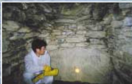
樋口古墳の石室 (徳島市上八万町樋口)