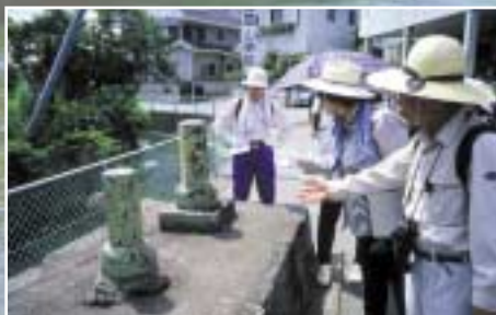
支流の冷田川で地神を調べる (徳島市八万町夷山)