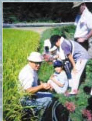
田んぼの畔で植物観察 (佐那河内村東地)