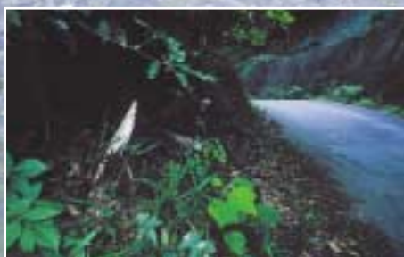
切り通しの魔除け札 (徳島市上八万町花房)