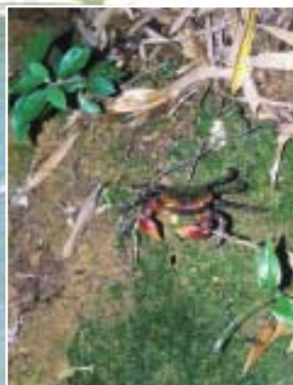
森の中で出会ったアカテガニ (徳島市八万町向寺山)